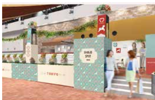
UMAJO SPOT フジビュースタンド5階10番柱付近