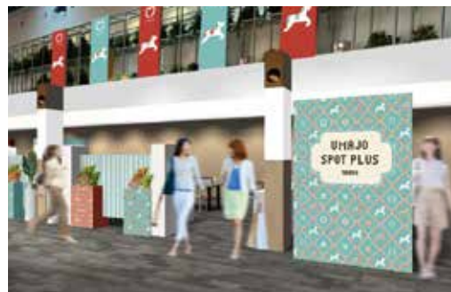
UMAJO SPOT PLUS フジビュースタンド5階27番柱付近