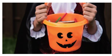
※画像はイメージです。 ※お申込みには、「競馬場イベント参加アプリ」が必要です。