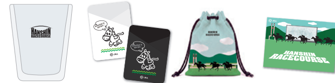
ダブルウォールグラス スマホカードポケット オリジナル巾着袋 ポケットティッシュ ※画像はイメージです。