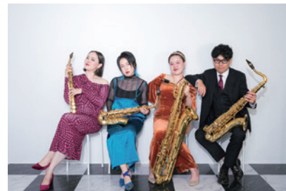
Green Ray Saxophone Quartet