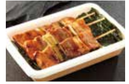
ハセガワストア [やきとり弁当]