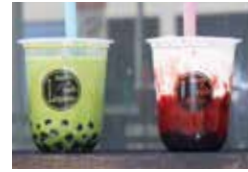
Lupinus [タピオカドリンク]