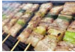
肉のふじた とりきち [豚串]