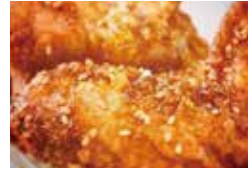
Jonnyの手羽先 [ジョニーの手羽先(しょうゆ)]