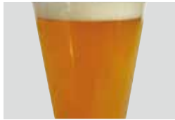
Ozigi/サッポロビール/アサヒビール [ビール・ソフトドリンク]