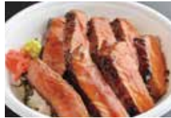
焼肉レストラン 沙蘭 [ステーキ丼]