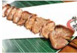
焼肉物語 牛若 [ジャンボ牛タン串]