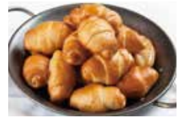
コッペン道士 [カチコチ塩パン]