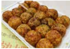
くだいおれ太閤 [たこ焼き]