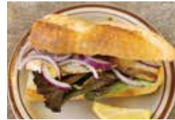
SANDWICH CLUB [サブサンドイッチ]