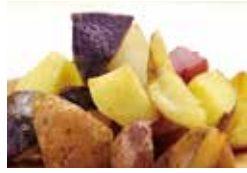
ジャがいもFACTORY×ポケットピザ [彩りフライドポテト]