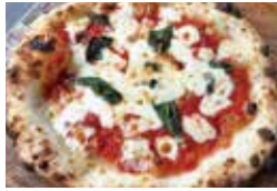
ぽこあぽこ [マルゲリータ]